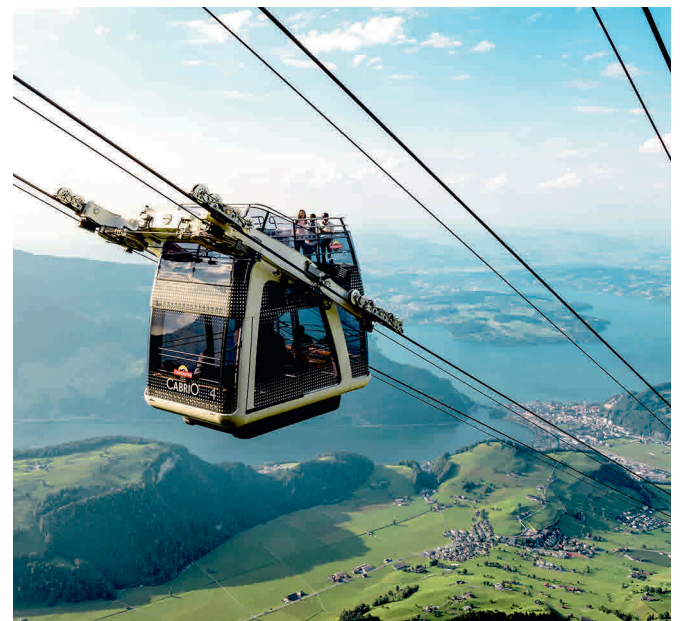
Stanserhorn, teleférico de CabriO