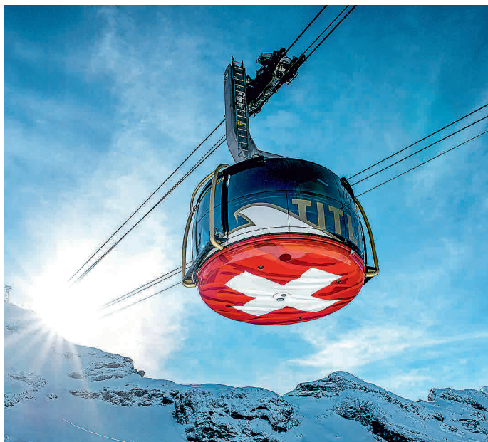
El nuevo teleférico giratorio TITLIS Rotair.