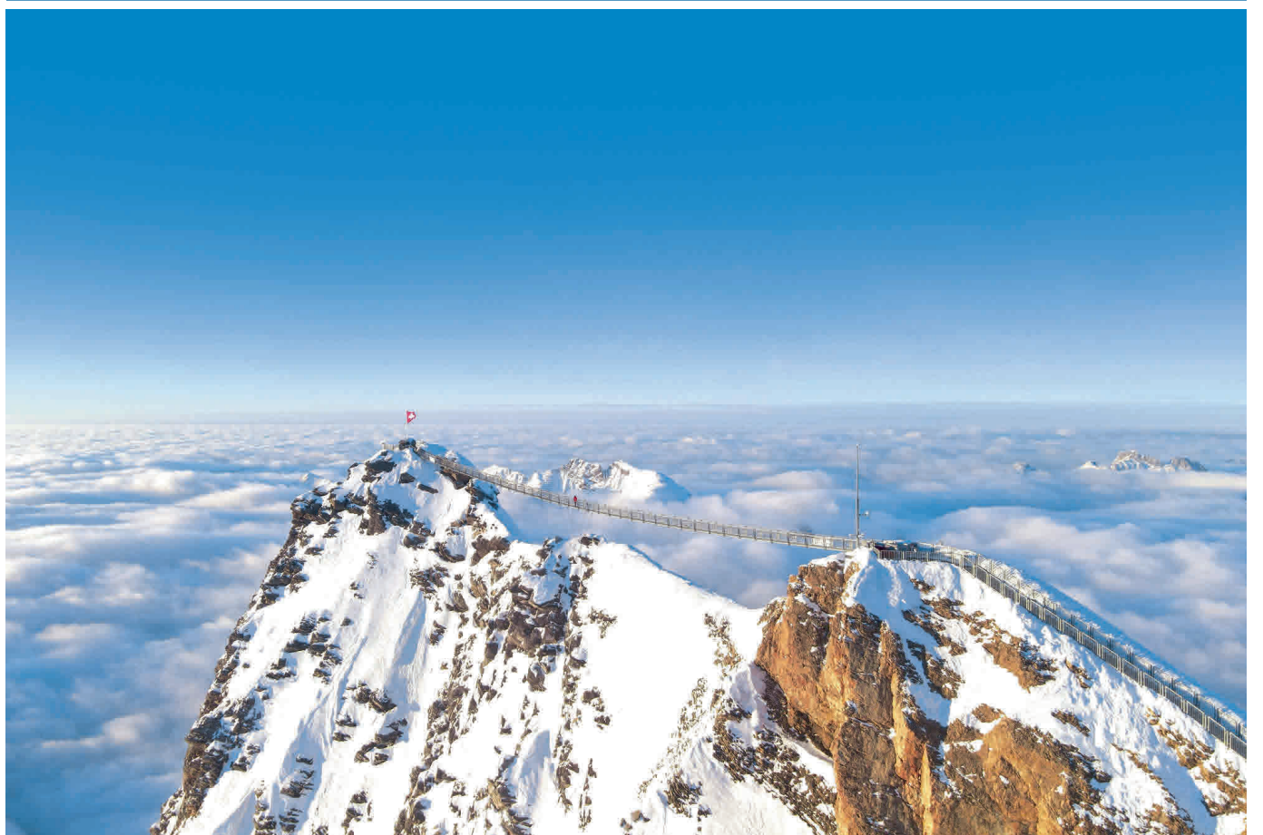
Glacier 3000, Puente Peak Walk de Tissot.

En tanto, la subida al Stanserhorn comienza a bordo de un funicular abierto, tambaleándose como hace 120 años, y luego continúa en el techo del moderno CabriO. El pequeño tren con vagones de madera que asciende desde Stans hacia el Stanserhorn circula desde el año 1893. En la estación intermedia, la nueva atracción es el teleférico con techo abierto. Volar por el aire desde la cima de esta doble cabina y ver pasar los postes es una sensación única. Al llegar, los guardabosques ayudan a los excursionistas a identificar las flores y los picos.