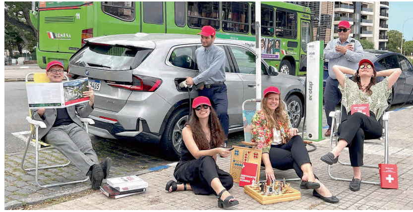
El equipo de la Embajada de Suiza en Uruguay con su nuevo coche 100% eléctrico.

—A menudo me preguntan sobre el tema “Uruguay: Suiza de América”. Yo siempre respondo: ¿Por qué no “Suiza: Uruguay de Europa”? Una de las razones del éxito de ambos Estados es la estabilidad y continuidad política, la seguridad jurídica y el relativo buen funcionamiento del Estado de bienestar. El tamaño manejable del país ayuda, al igual que los elementos de democracia directa que dan a los ciudadanos cierto grado de control sobre los políticos, y voz en los asuntos más relevantes. Los ciudadanos también se identifican en ambos países con el sistema estatal, éste es importante para la estabilidad y una ventaja económica, especialmente en los tiempos turbulentos que corren. La estructura de la economía también es similar: en el futuro, el sector de servicios desempeñará un papel cada vez más importante en ambos países.