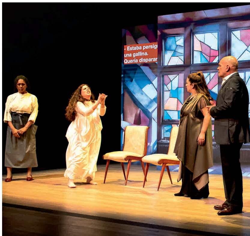
El proyecto V.I.D.A. promueve la inclusión social a través del arte.

En 2023, la Embajada de Suiza colaboró con V.I.D.A. en su obra Las rosas de Luisa , presentada con gran suceso en la Sala Zavala Muñiz del Teatro Solís.